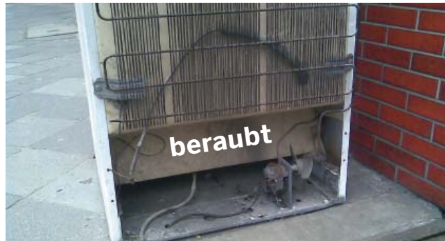
Kühlgerät bei dem der Kompressor geraubt wurde

Bis zu 40 % der Altgeräte, die durch die Straßensammlung erfasst werden, sind in erheblichem Maße beschädigt. Helfen Sie bitte mit!